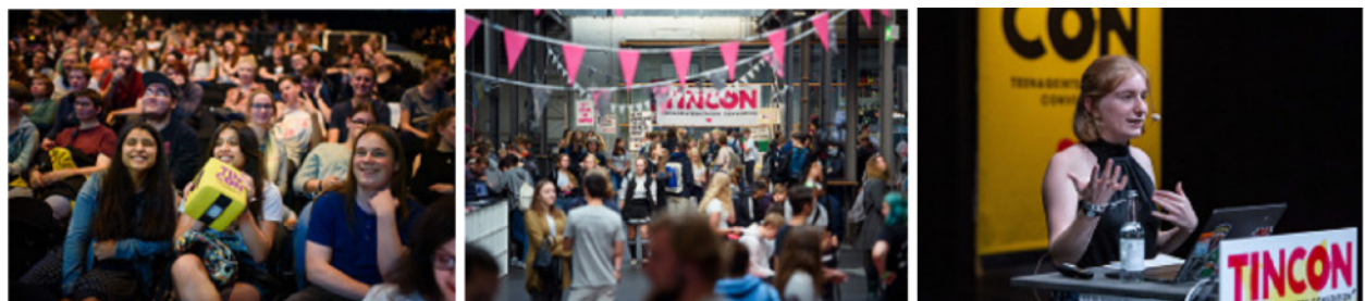
Zu den hochauflösenden Fotos

Die TINCON, die Jugendkonferenz zur digitalen Gesellschaft, vom 6.-8. Mai 2019 in Berlin